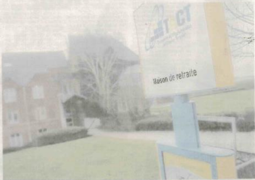
Les visites sont interdites au sein de l'Ehpad sauf cas d'urgence.

hospitalier de Saint-Quentin de Chauny précise