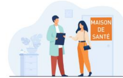
Soins de ville