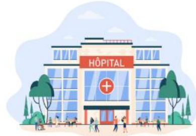
Etablissements de santé

Ne pas utiliser le navigateur Internet Explorer.