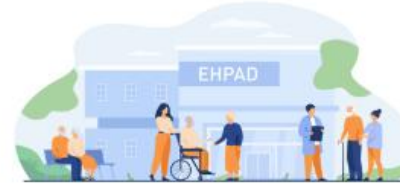
Etablissements et services médico-sociaux