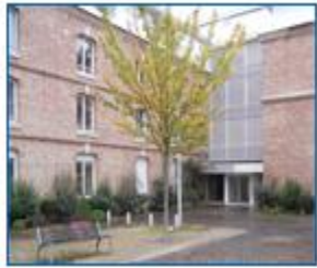
Résidence Les Quatre Chênes