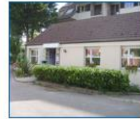
Accueil de Jour Les Saules