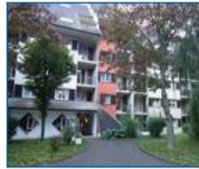
Résidence Léon Burckel

Capacité d'accueil 96 résidents Dont 4 places en HT