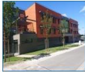
EHPAD Paul Claudel