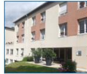
Résidence Château de Montières

Capacité d'accueil 96 résidents Dont 4 places en HT